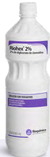
FRASCO 1L ANATÔMICO